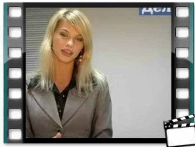
Как успешно пройти собеседование