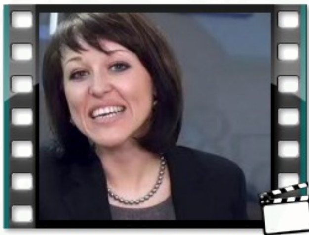
Как пройти собеседование (Antal Russia)